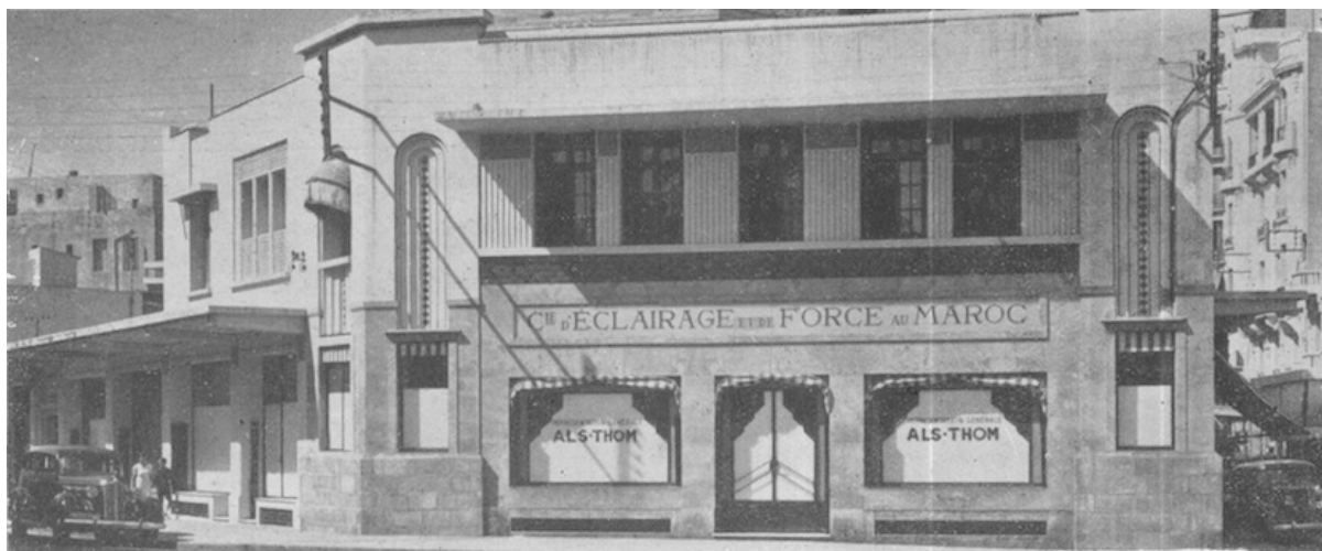
Vue des bureaux de la Cie d'éclairage et de force à Casablanca

Compagnie d'éclairage et de force au Maroc Rue Blaise-Pascal - CASABLANCA Boîte postale 255 - Téléphone - À 29-65 (Édouard SARRAT, Le Maroc en 1938 , Édition de l'Afrique du Nord illustrée, 292 pages, Casablanca, 1938) www.entreprises-coloniales.fr/afrique-du-nord/Sarrat-Maroc_1938.pdf