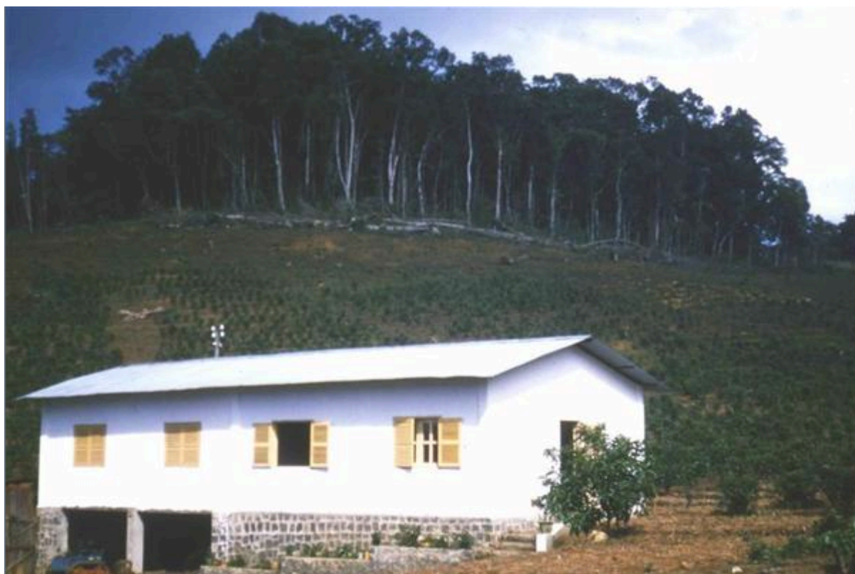
Maison annexe de la plantation Dubourg (juillet 1959).