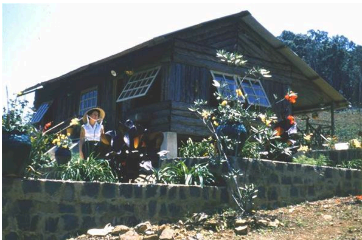
Maison principale de la plantation Dubourg. La femme blanche avec chapeau vietnamien est M me Roger Chazal.