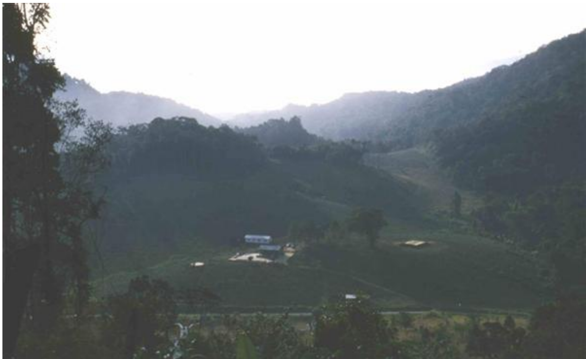
Les collines autour du col de Blao avec les bâtiments de la plantation Georges Dubourg (1959).

Planteur de caoutchouc, puis patron des Céramiques du Donai, Georges Dubourg achète au milieu des années 1950 une petite plantation de thé, au km 183 de la route Saïgon-Djiring, à la sortie du col de Blao, au-dessus de la plantation d'ananas Didier. Cette propriété contenait de vieux plants qui remonteraient à l'époque du Domaine agricole de Blao .