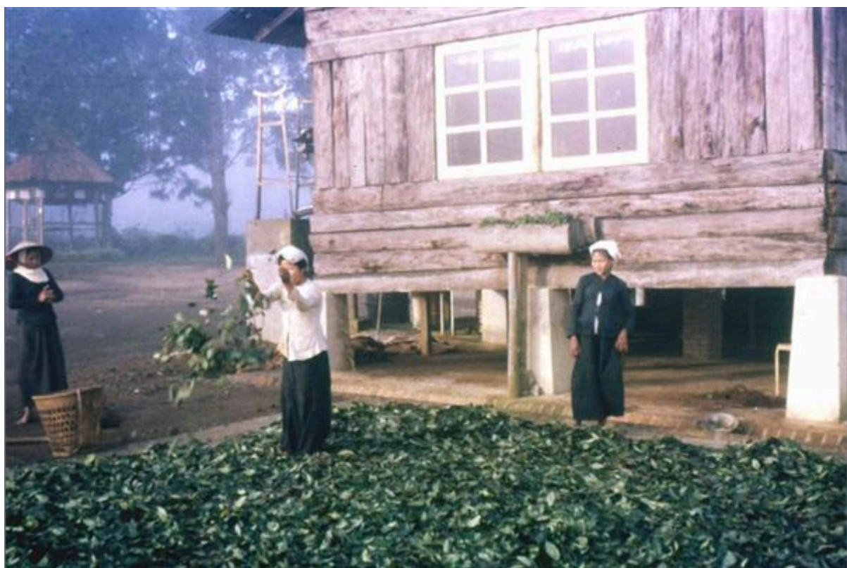
Séchage du thé près de la maison Dubourg.