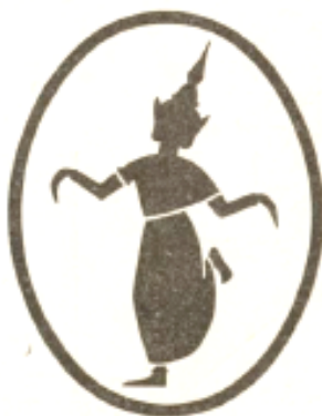
RIZ « APSARA » Marque déposée.